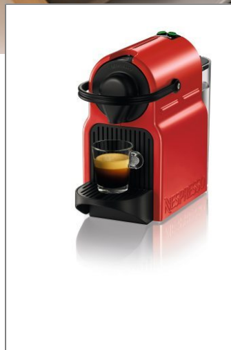
NESPRESSO INISSIA XN1005CH